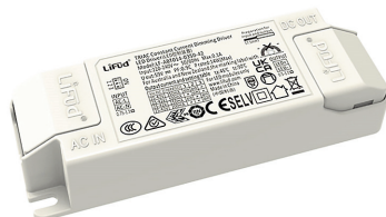
EN3175 Driver für Anoxa 15W CCT Phasenabschnittgesteuerter variabler Treiber