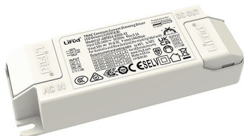
EN3125 Driver pour Anoxa 12W CCT Variation par coupure de phase