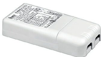
DR6450 Mini Jolly LC DALI Variation par signal DALI